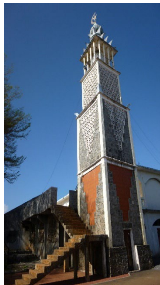
Figure 2 : mosquée de Tsingoni

Mayotte est régulièrement marquée par des crises : crises sociales, avec des mouvements sociaux pouvant paralyser l'île, crises hydriques entraînant des coupures d'eau par alternance pouvant aller jusqu'à 72 heures, crises sismiques, liées à la présence d'un volcan sous-marin situé à quelques kilomètres à l'est des côtes mahoraises. Le passage du cyclone Chido en décembre 2024 et de la tempête Dikeledi en janvier de la même année a particulièrement fragilisé l'île.